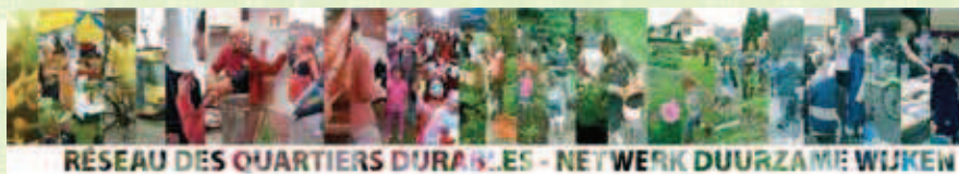
RÉSEAU DES QUARTIERS DURABLES - NETWERK DUURZAME WIJKEN