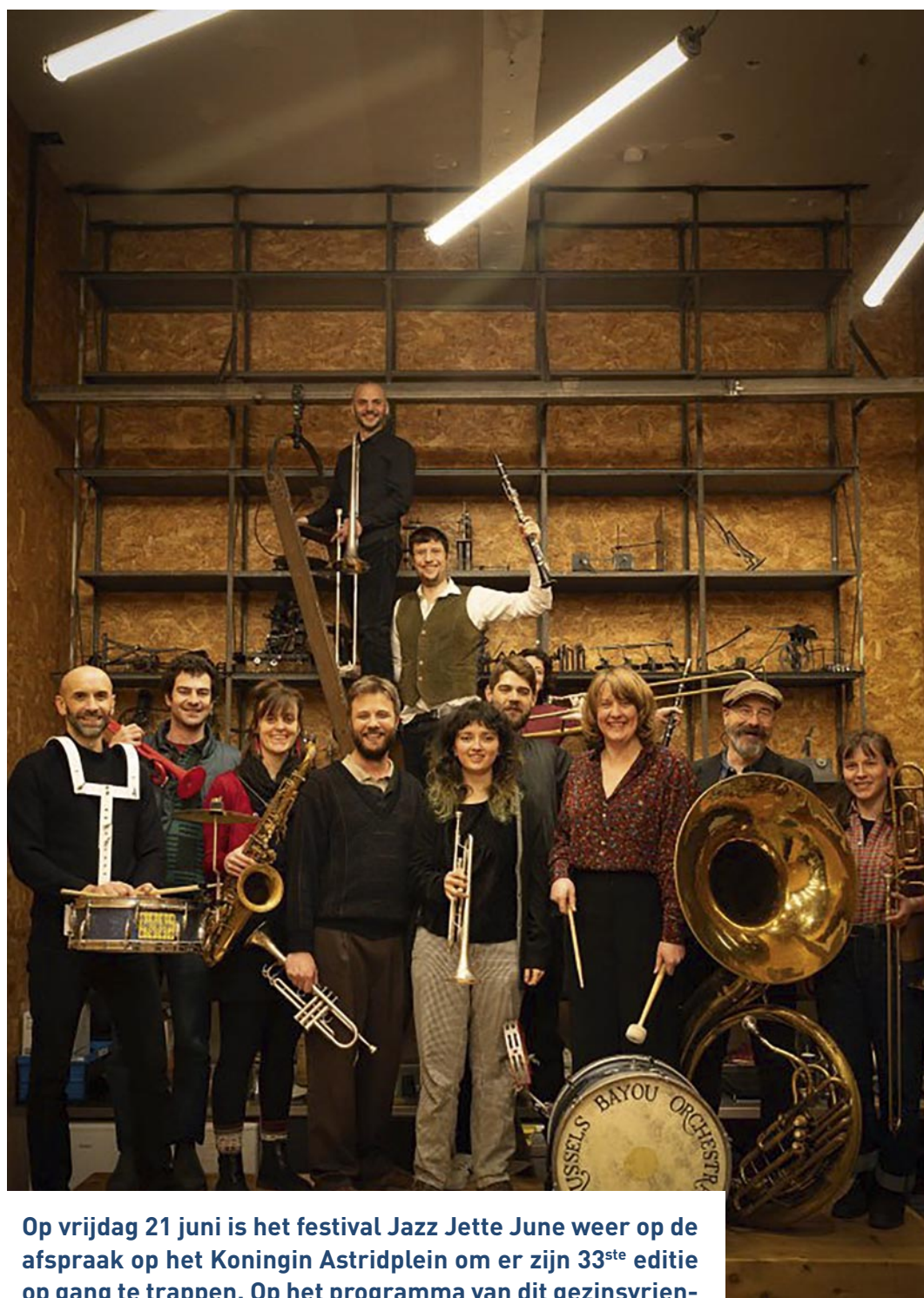
Brussels Bayou Orchestra

Op vrijdag 21 juni is het festival Jazz Jette June weer op de afspraak op het Koningin Astridplein om er zijn 33 ste editie op gang te trappen. Op het programma van dit gezinsvriendelijk en gratis evenement, georganiseerd door het Centre culturel de Jette: jazzdeuntjes om op een sfeervolle en feestelijke manier de zomer in te zetten.