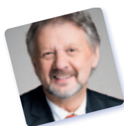
HERVÉ DOYEN BURGEMEESTER

Tijdens de zitting van eind januari gaf de gemeenteraad de goedkeuring aan de overeenkomst tussen de gemeente Jette en het CIBG betreffende de installatie van een informatiebeheersysteem. Vanuit ecologisch en functioneel oogpunt werkt de gemeente Jette sinds enige tijd aan de digitalisering en automatisering van verschillende processen, met name door een frequenter gebruik van elektronische handtekeningen. Ze wil dus ook beschikken over een tool voor de bewaring en archivering van officiële documenten onder digitale vorm, die de noodzakelijke en wettelijke garanties biedt qua integriteit, toegankelijkheid en betrouwbaarheid van de informatie. Daarom heeft Jette als pilotgemeente de handen in elkaar geslagen met het CIBG voor de ontwikkeling van een innovatief informatiebeheersysteem dat op langere termijn door andere gemeenten of organisaties van het Brussels Hoofdstedelijk Gewest zou kunnen overgenomen worden. De volgende gemeenteraad is op woensdag 30 maart om 18.30u • U vindt de dagorde en de inhoud van elke gemeenteraad op https://publi.irisnet.be