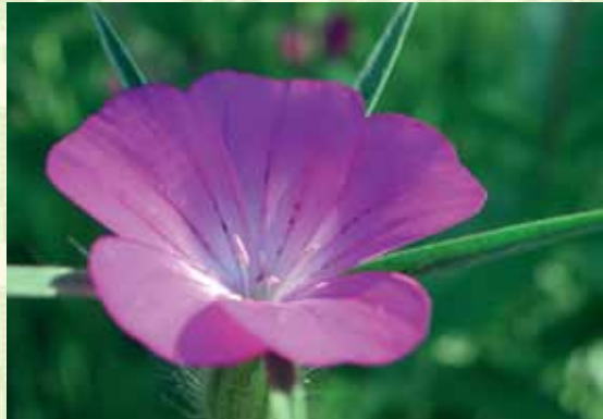
Nielle des blés

L'arrosage est souvent difficile à doser. L'excès d'eau peut-être néfaste. En effet, une saturation en eau peut provoquer le pourrissement des racines. Evitez donc de laisser de l'eau stagnante dans les soucoupes de vos jardinières et préférez laisser sécher le terreau entre deux apports en eau.