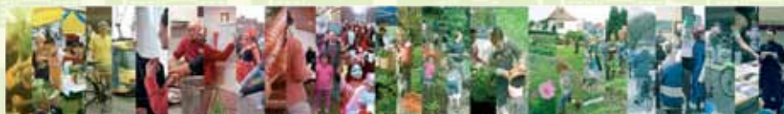
RÉSEAU DES QUARTIERS DURABLES - NETWERK DUURZAME WIJKEN

L'objectif de l'accompagnement « Quartier durable » est d'aider les habitants à changer leurs comportements et adapter leur environnement afin de préserver la planète et de développer le bien être de tous.