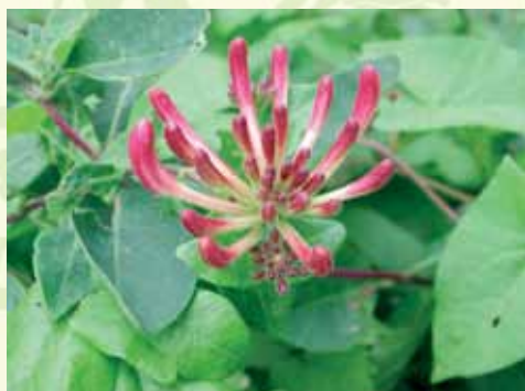
Chèvrefeuille des bois