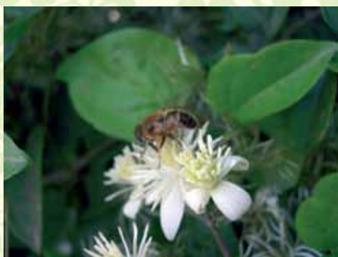
Clématite des haies

La plupart des plantes grimpantes ont besoin d'un support pour s'accrocher. Vous pouvez les aider en fixant sur le mur des câbles, des treillages ou lattis, etc.