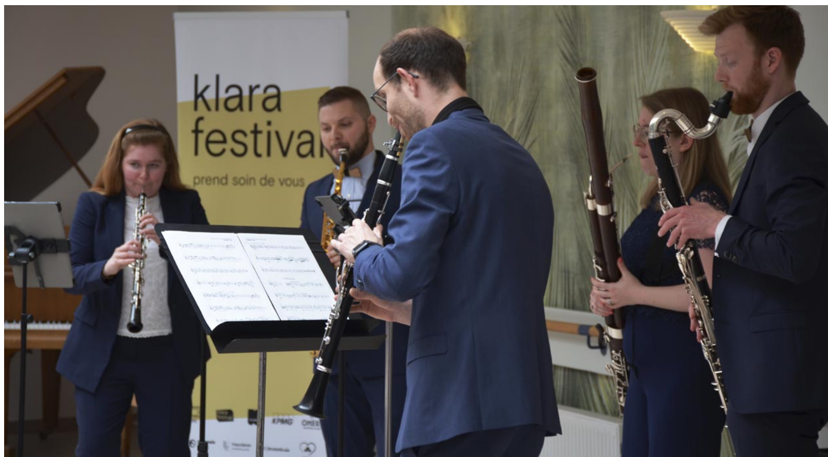
Woodwork Reed Quintet

Musique et danse de qualité exceptionnelle