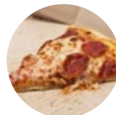
8. Reste de pizza