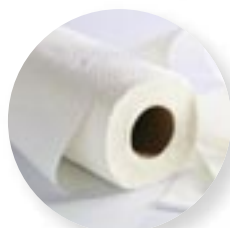
2. Papier de cuisine