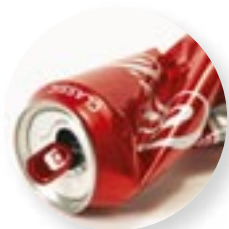
3. Canette de Coca