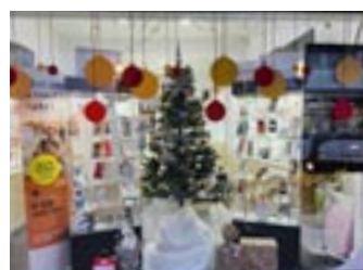
5 ème prix i-Shop Informatique/téléphonie Rue Léon Theodor 8