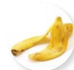
4. Epluchures de fruits