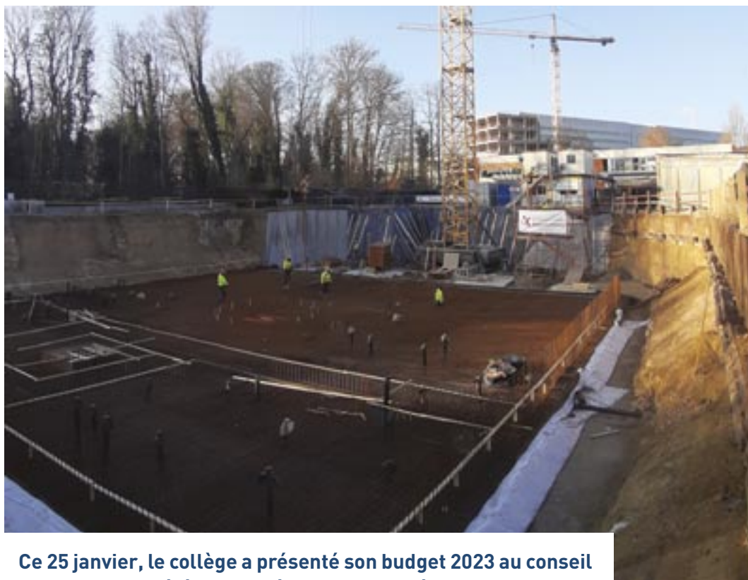
Ce 25 janvier, le collège a présenté son budget 2023 au conseil communal. Il a été approuvé par l'assemblée.

D epuis de très nombreuses années, notre commune met un point d'honneur à préserver des finances communales saines. Cet objectif est essentiel pour garantir des services publics de qualité et assurer leur continuité à long terme. Cette année encore, ce budget sera donc à l'équilibre. Cela signifie que la commune ne dépensera pas plus que ce qu'elle ne gagne.