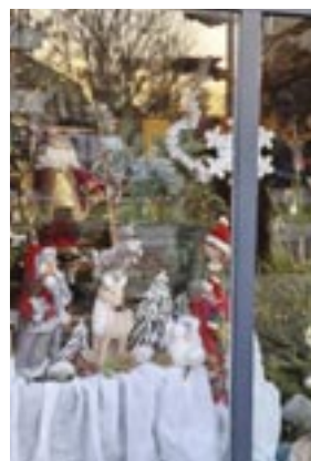
2 ème prix Chanson Boulangerie-pâtisserie Avenue G. De Greef 55