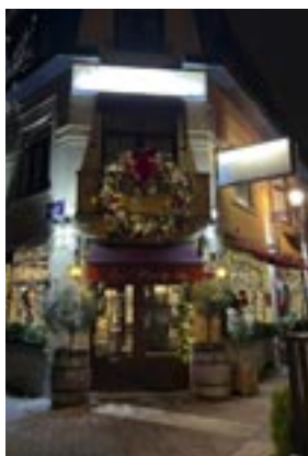
1 er prix La Penisola Restaurant Rue P. Timmermans 63

Du côté des particuliers, les gagnants ont reçu un bon d'achat d'une valeur de 40 à 300 € (premier prix) à dépenser auprès des commerces locaux. Du côté des commerçants, vous pouvez découvrir ci-contre et sur les réseaux sociaux les photos des étalages gagnants, à savoir :