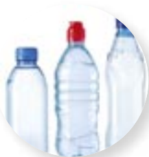
7. Bouteille en plastique