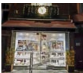
4 ème prix Or-Fée Bijoutier Place Reine Astrid 10