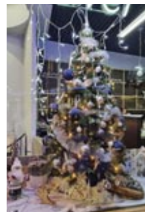
3 ème prix Jetexpress Agence de voyage Place Reine Astrid 2