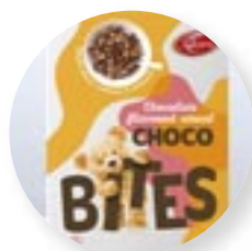
5. Emballage de céréales en carton