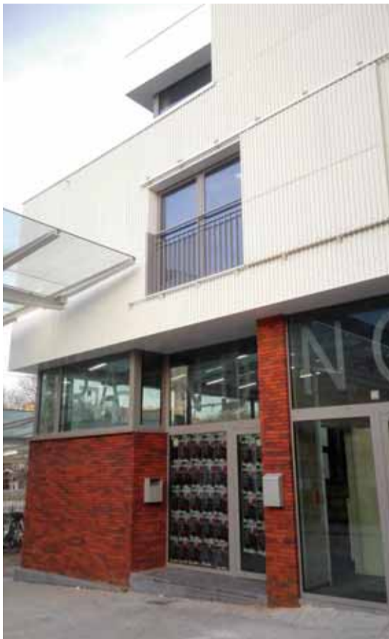
Une initiative de l'asbl Jeugdhuizen Ondersteuning Brussel, avec le soutien de la VGC et de la Communauté flamande