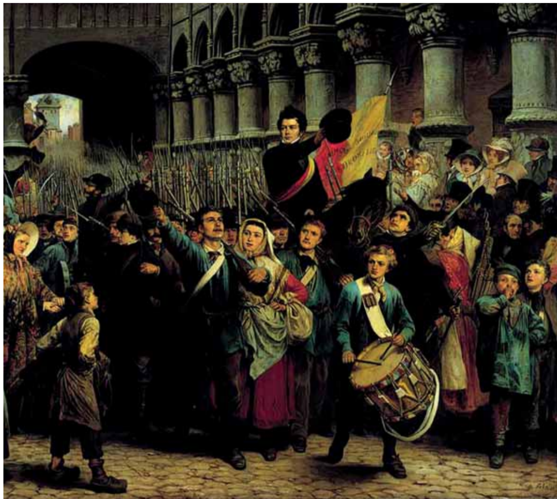
Avec le soutien de l'échevin de la Culture française